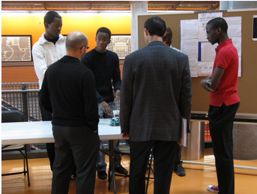
Figure 2 Évaluation d'une présentation par affiche par deux juges